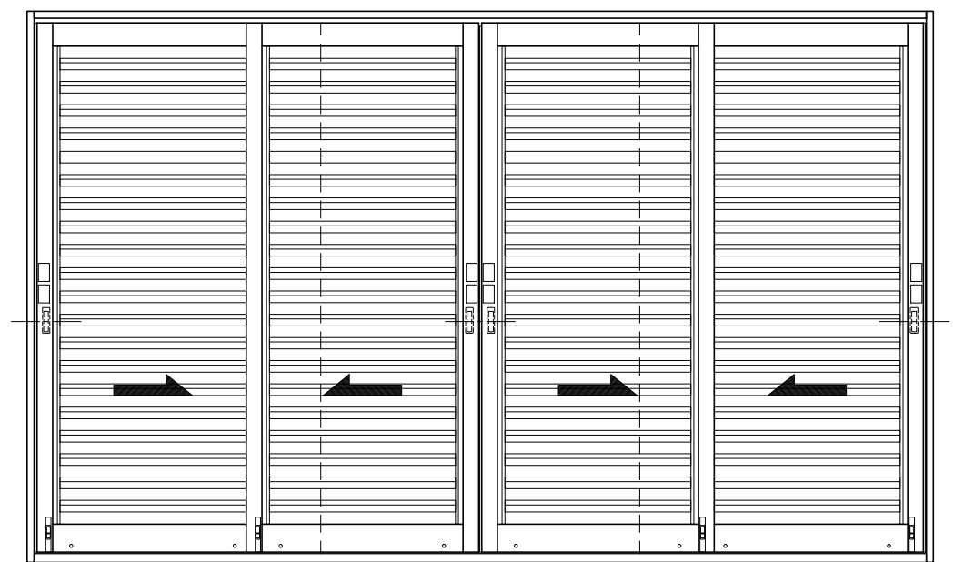
アリーナ側観図 ■4枚建引違いタイプ